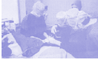
Ein Schwerpunkt ist die Abdominalchirurgie- Eingriffe an den Bauchorganen

Bereits im ersten Vierteljahr wurde bei laparoskopischen Eingriffen die Gesamtzahl des Vorjahres weit überschritten. «Die Anwendung der Schlüssellochchirurgie bei Krebserkrankungen ist noch umstritten,» meint Wiesinger und erklärt: «Gerade bei einem bösartigen Tumor stellt sich die Frage: Ist der Eingriff auch radikal genug?» Konventionelle Chirurgie bleibt hier vorerst die Regel. Doch auch hier gibt es Fortschritte: Brustkrebs kann heute brusterhaltend operiert werden wenn bestimmte Voraussetzungen -etwa ein Tumordurchmesser von unter drei Zentimetern- gegeben ist. Und muss eine Brust doch ganz entfernt werden, so bieten sich durch die plastische Chirurgie Möglichkeiten des Wiederaufbaus. Krebschirurgie ist ein weiterer wesentlicher Schwerpunkt im LKH Villach. Lisa Kassir